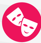
Loso tuke manigi puonj kod drama